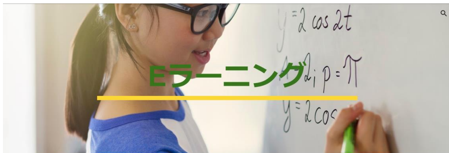
生徒用ガジェット

『Googleサイト、サテライトオフィス・ポータルサイト用ガジェット』について、ご説明いたします。