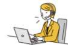
メール・電話でのサポート