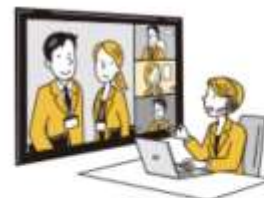
ビデオ会議を使ってサポート

企業様、学校向けの導入実績豊富なサテライトオフィスにおまかせください！専任の担当者がサポートさせていただきます。受付した内容は担当者様へフィードバックさせていただきます。