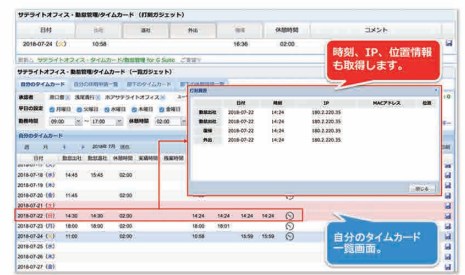
時間、IP、位置情報を取得