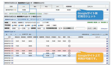
Googleサイトで利用可能