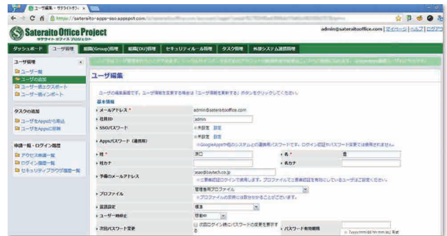
各種セキュリティー管理の管理画面