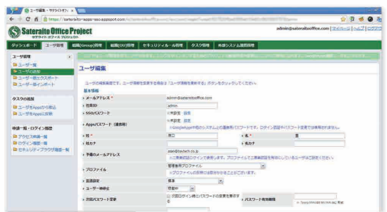
各種セキュリティー管理の管理画面

サテライトオフィス・セキュリティーブラウザ for G Suite は、AppStore,GooglePlay等から簡単にインストール可能です。 サーバー側はGoogle App Engineで構築しています。欲しい機能がありましたら、お気軽にご連絡ください！